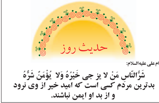
امام علی علیه‌السلام:

شَرُّ النَّاسِ لَنْ يَأْزِجَ خَيْرَهُ وَلَا يُؤْتَمَنُ شَرُّهُ بدترین مردم کسی است که امید خیر از وی نرود و از بد او ایمن نباشند.