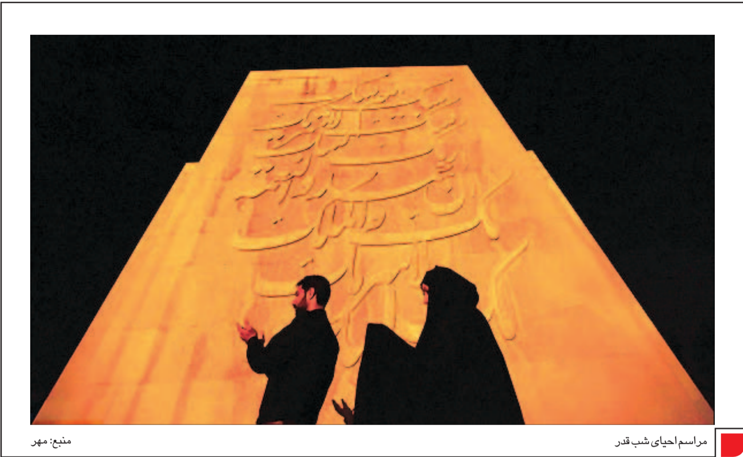
مراسم احیای شب قدر